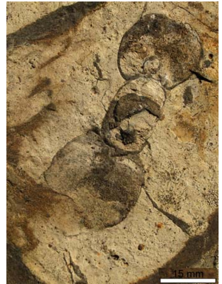
Tverrsnitt av fossil blekksprut (Discoceras) ved stopp 2

Både her, og videre oppover står også skifrene på høykant, til tross for at de ble dannet som flattliggende avsetningsbergarter. Hvordan kan det ha skjedd? Avsetningene (slam og leire) ble opprinnelig begravd stadig dypere ved nye avsetninger, og til slutt ble de varmet opp langt nede i jordskorpa og samtidig utsatt for høyt trykk gjennom lang tid. På den måten ble de løse slam- og leiravsetningene omdannet til hard leirskifer. Samtidig har bevegelser i jordskorpa ført til kollisjon mellom datidens europeiske og nordamerikanske kontinenter, og bergartene ble foldet og reist på høykant. Tilsvarende steiltstående skifre og kalkbergarter kan vi se i hele Oslo-området.