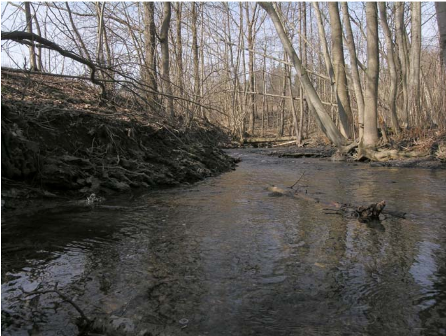
Bekken har et stille løp ovenfor stopp 3