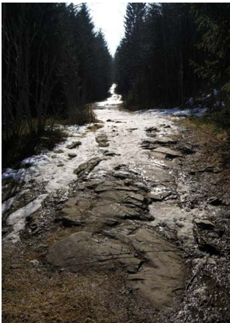
Akeritt, innover Ankerveien (stopp 11)