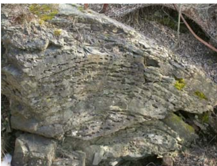
Foldet leirskifer, der kalk-knollene er forvitret, — bare hullene er igjen (stopp 5)

På østsiden av bekken ser vi her en tydelig fold i leirskiferen. Folden danner en opp-ned U-fasong, og kalles da en antiklinal. Man kan godt forstå at det må voldsomme krefter til å folde tykke bergarter som dette.