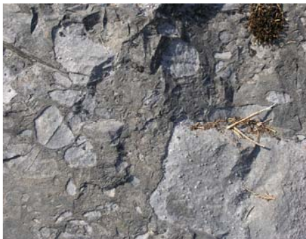
Konglomerat med kantete kalkboller i kalk-sandsteinen ved stopp 8

Her ser vi en halv meter bred diabasgang fra permtiden. Midt inni diabasgangen finner vi bruddstykker av en annen bergart: nordmarkitt. Nordmarkitt er en bergart i syenittfamilien som har størknet dypt nede i jordskorpa. Den ligner på granitt, men skiller seg fra dem ved at den har lite eller ikke noe av mineralet kvarts. Hvordan har disse nordmarkittbitene kommet inn i diabasen? På sin vei opp fra dypet har diabas-smelten revet med seg stykker av nordmarkitten og transportert disse oppover. Ut fra dette kan vi også slutte at diabasen her må være yngre enn nordmarkitten. Slike "fremmede" bergartsfragmenter i en smeltebergart kalles også xenolitter (fremmedstein). Nordmarkitt er for øvrig den viktigste bergarten for utformingen av det høyere terrenget i Nordmarka.