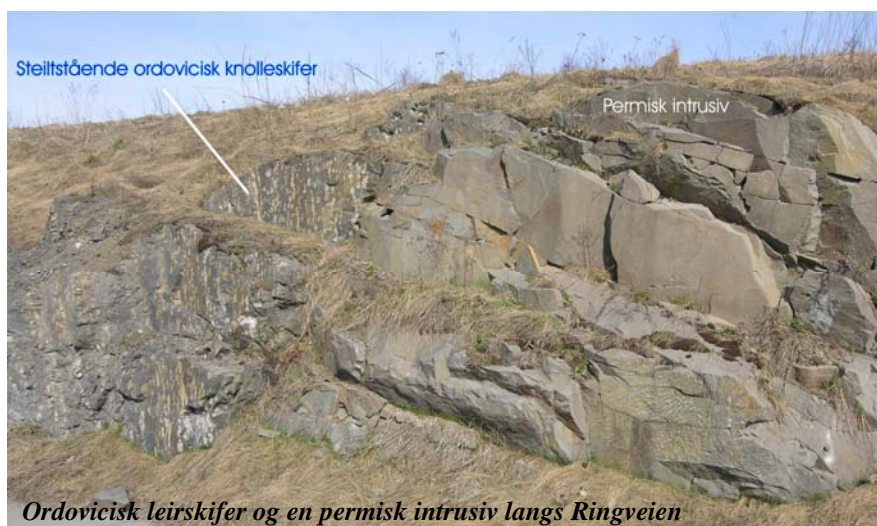
Ordovicisk leirskifer og en permisk intrusiv langs Ringveien

Ved skiltet i svingen ser vi mot vest typiske lagdelte skifre med kalkknol- ler. Ser vi nøye etter, så kan vi opp- dage fossiler i kalkknollene, bl.a. blekkspruter ( Discoceras ), brachio- poder, koraller, trilobitter og mosdyr. Disse opptrer oftest som mørkere