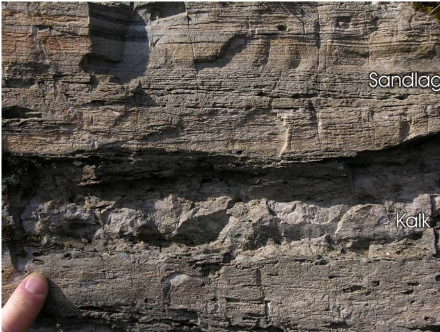
Kalksandstein (stopp 8)