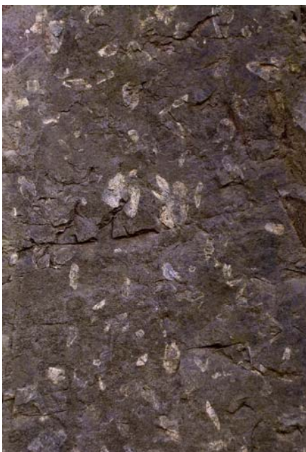
Rombe porfyrr ved stopp 1

Denne stoppen ligger på østsiden av Slemdalsveien vis-à-vis T-banestasjonen. Her hever terrenget seg i en bergrygg. Bergarten her er en rombeporfyrr, dannet av en smeltmasse som trengte seg opp i permtiden for rundt 250-300 millioner år siden. Som navnet antyder består bergarten av en rekke lyse