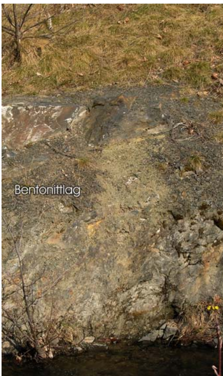
Over: Fossilt askelag (bentonitt) Under: Isskuret diabas ved stopp 2

tverrsnitt av fossilenes tynne skall. Ut fra fossilene kan vi finne omtrentlig alder på bergartene – i dette tilfelle tyder fossilene på at bergarten er rundt 460-440 millioner år gamle. På østsiden av stien går det en rygg tvers over bekken og danner et lite fossefall. Ryggen her skyldes en eruptivgang av diabas – en bergart