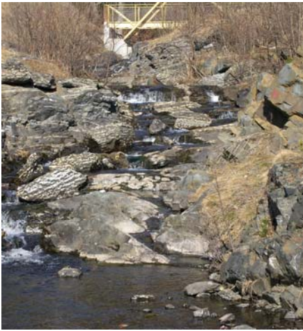
Knolleskifer og diabas ved stopp 2

tverrsnitt av fossilenes tynne skall. Ut fra fossilene kan vi finne omtrentlig alder på bergartene – i dette tilfelle tyder fossilene på at bergarten er rundt 460-440 millioner år gamle. På østsiden av stien går det en rygg tvers over bekken og danner et lite fossefall. Ryggen her skyldes en eruptivgang av diabas – en bergart